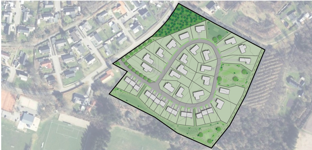
Vejledende illustrationsplan for lokalplanområdet