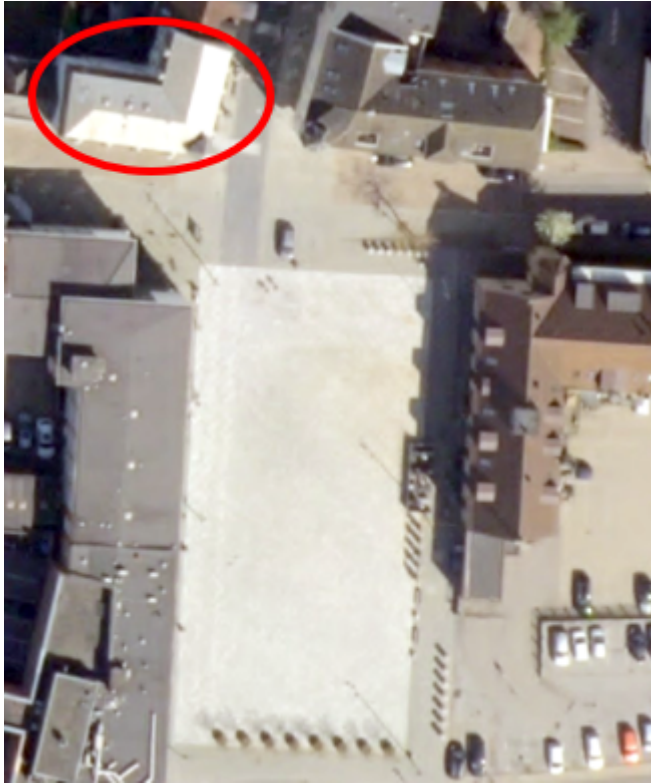
Figur 1: Tidligere placering af kirke i det røde område.