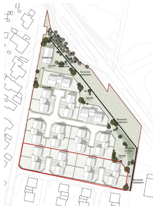
Figur 2 - Illustrationsplan fra lokalplanforslaget Eksisterende bebyggelse markeret m. rødt omrids.

Lokalplanen fastlægger principper for beplantning, så de fælles udendørs opholdsarealer og støjvæg beplantes med hjemmehørende træer og buske for at opnå grønne, varierede og attraktive fælles grønne udendørs opholdsarealer. Planen sikrer variation i bebyggelsens arkitektoniske udtryk, for at undgå at området som helhed opleves monotont og ensartet. Planen sikrer gode stiforbindelser gennem området, så beboere får adgang til fælles udendørs opholdsarealer. Lokalplanen sikrer at både hverdags- og skybrudsregn kan håndteres på terræn og at anlæg til vandhåndtering kan indgå naturligt i området som et landskabeligt og rekreativt element. Lokalplanen sikrer også etablering af støjreducerende foranstaltninger i form af støjvæg, så boliger, haver og fælles udendørs opholdsarealer ikke er støjbelastede.