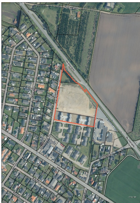
Figur 1 - Afgrænsning af lokalplanområdet

For at sikre overensstemmelse mellem lokalplanforslaget og kommuneplanen, er der udarbejdet et kommuneplantillæg.