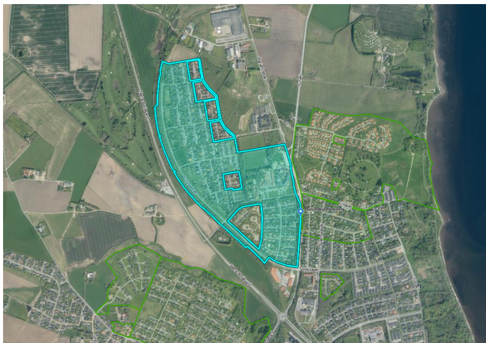
Figur 1: Placering af grundejerforeningen Frugtparken.

Grundejerforeningen har 356 husstandsmedlemmer, herunder mange børnefamilier, og forventer at projektet vil komme både børn, unge og voksne til gavn.