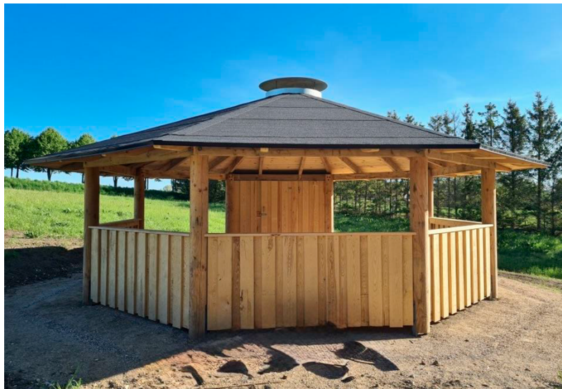
Figur 3: Foto af lignende bålhytte, som ønskes opført. Bålhytten opføres dog uden sider, som vist på billedet.