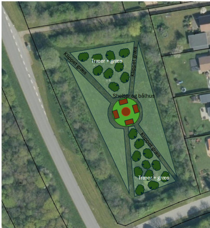
Figur 2: Plantegning over shelterpladsen.