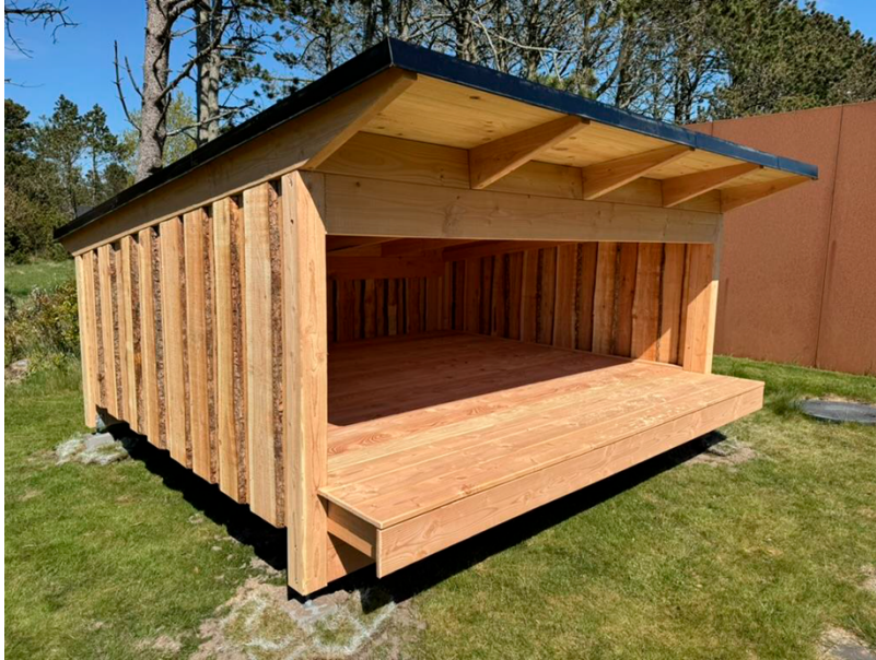
Figur 4: Foto af lignende shelter, som ønskes opført.