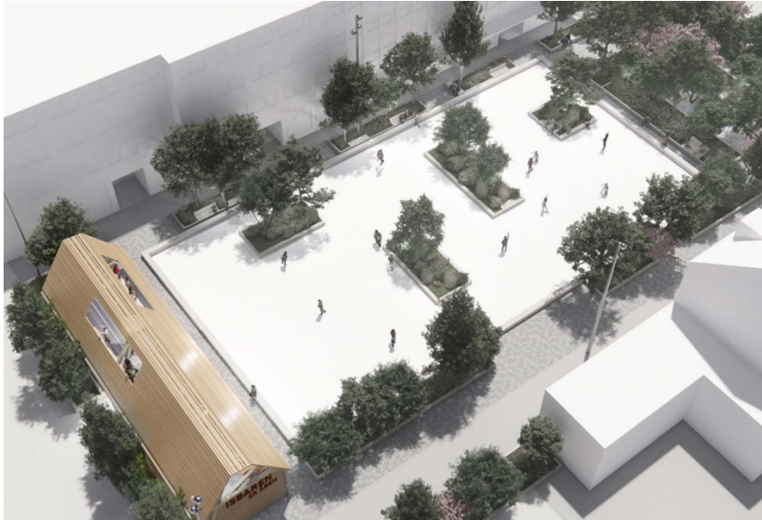
Figur 1: Skøjtebanens udformning i skitseforslaget.

Skøjtebanen er i skitseforslaget udformet med bede, hvori der er plantet træer, jf. figur 1. Ungdomsskolen ønsker at skøjtebanen bevarer sin oprindelige form, der i dag er firkantet uden forhindringer inde på banen.