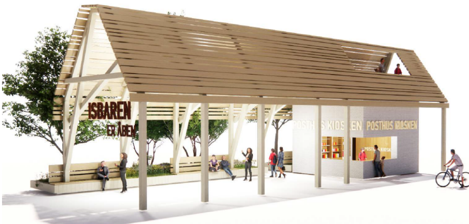
Figur 2: Bygning ud mod Tværgade.

Ungdomsskolen ønsker at kiosken og skøjteudlejningen foregår det samme sted, da de ikke har kapacitet til at betjene to områder.