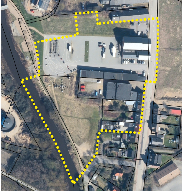
Foreløbig afgrænsning af lokalplan nr. 347 -Boligområde mellem Elværet og Skive Å