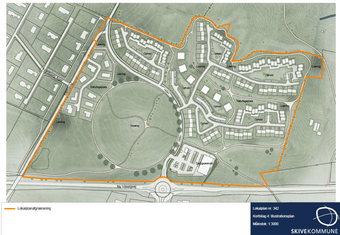
Fig 1.: Illustrationsplan for de kommende boligområder og den nye dagligvarebutik.

Som det er i dag, er Stårupvej tilsluttet Viborgvej i Dommerby. Adgangen til Fjordbjerg Ager er derfor som det er i dag gennem Dommerby og via broen over Ny Viborgvej. I forbindelse med lokalplanlægningen for de nye boligområder på Fjordbjerg Ager, planlægges for, at den nuværende adgangsvej (Stårupvej) til området bibeholdes som en sekundær adgangsvej med lav hastighed for passerende.