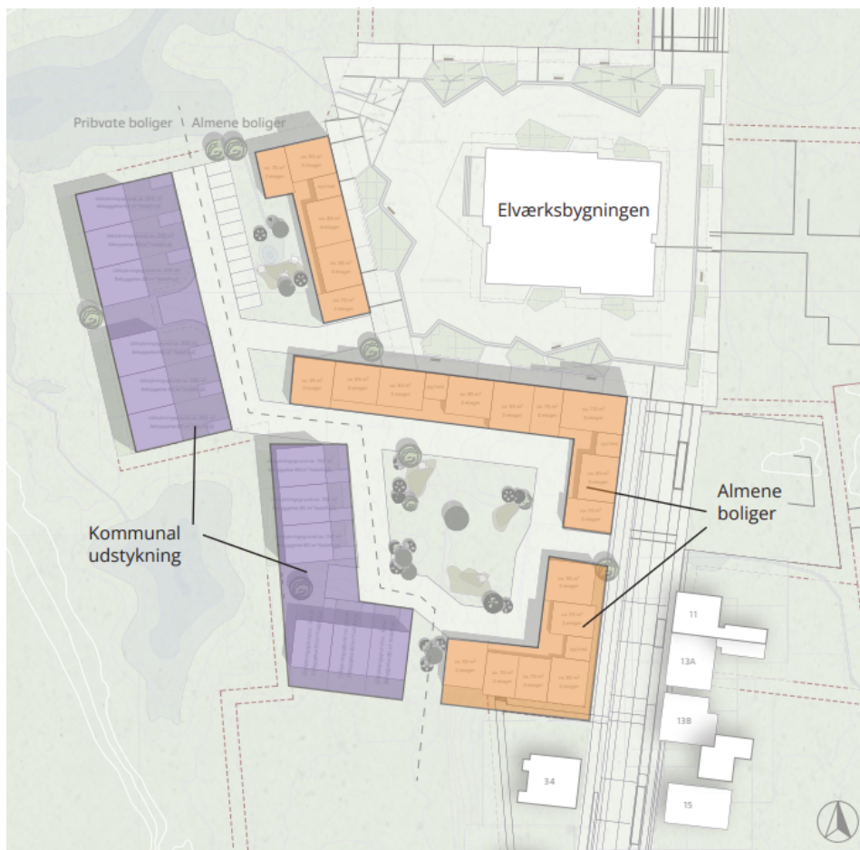
Fordelingen af den kommunale udstykning og almene etageboliger

Der er endnu ikke udarbejdet et konkret projektforslag for bebyggelsen. Dette arbejde vil ske i tæt dialog mellem bygherre og Skive Kommune undervejs i lokalplanprocessen, både hvad angår højder, udseende, præcis placering, grønne områder mv.