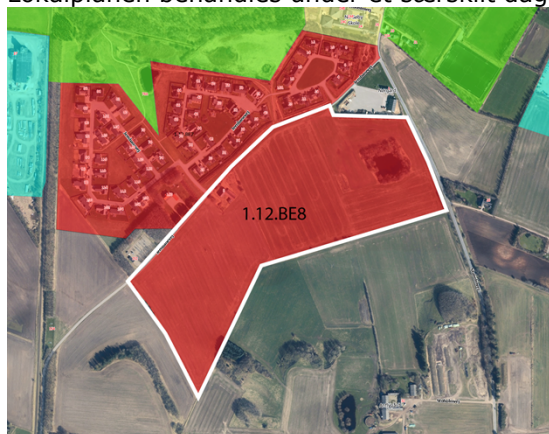
Figur 1 – Kommuneplanrammens afgrænsning Figur 2 – Principsnit for bebyggelse indpasset i terræn.

I forbindelse med planlægningen for lokalplan nr. 334 – Et boligområde syd for Jernbanevej i Nr. Søby har forvaltningen vurderet at lokalplanen forudsætter en mindre ændring af kommuneplanramme 1.12.BE8. For at sikre overensstemmelse mellem lokalplanforslaget og kommuneplanen, er der udarbejdet et tillæg nr. 5 til Skive Kommuneplan 2024-2036. Lokalplanen behandles under et særskilt dagsordenpunkt.