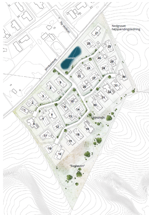
Figur 1 – Afgrensning af lokalplanområdet